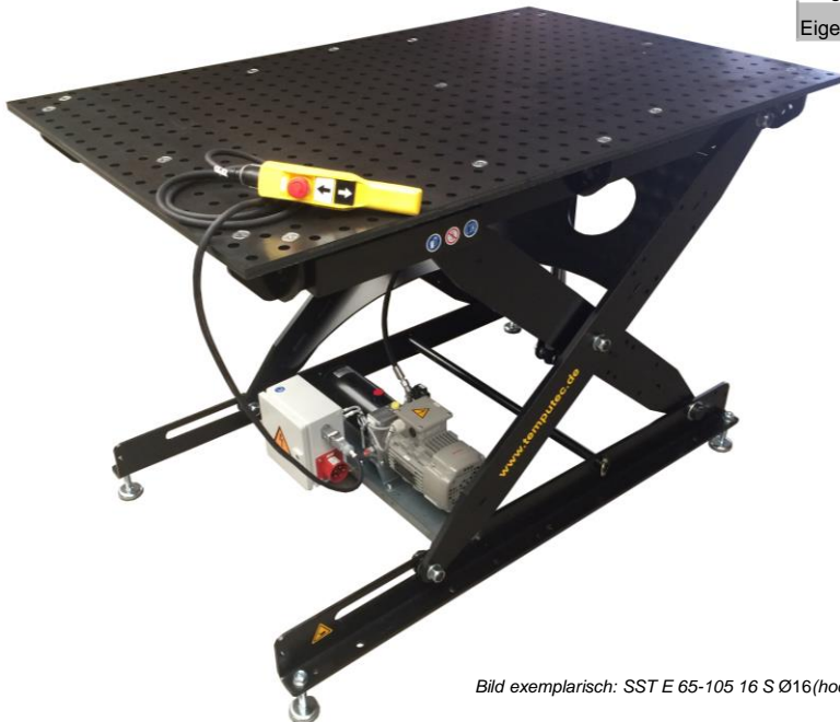
Bild exemplarisch: SST E 65-105 16 S Ø16(hoch)