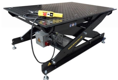
Bild exemplarisch: SST E 65-105 16 S Ø16(tief)