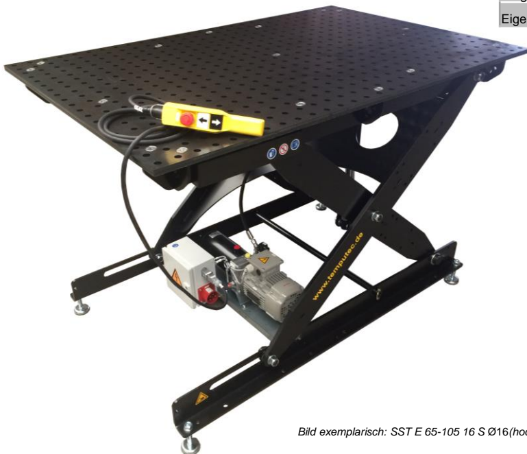
Bild exemplarisch: SST E 65-105 16 S Ø16(hoch)