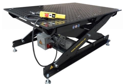
Bild exemplarisch: SST E 65-105 16 S Ø16(tief)