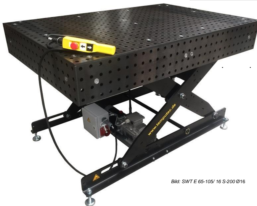
Bild: SWT E 65-105/ 16 S-200 Ø16