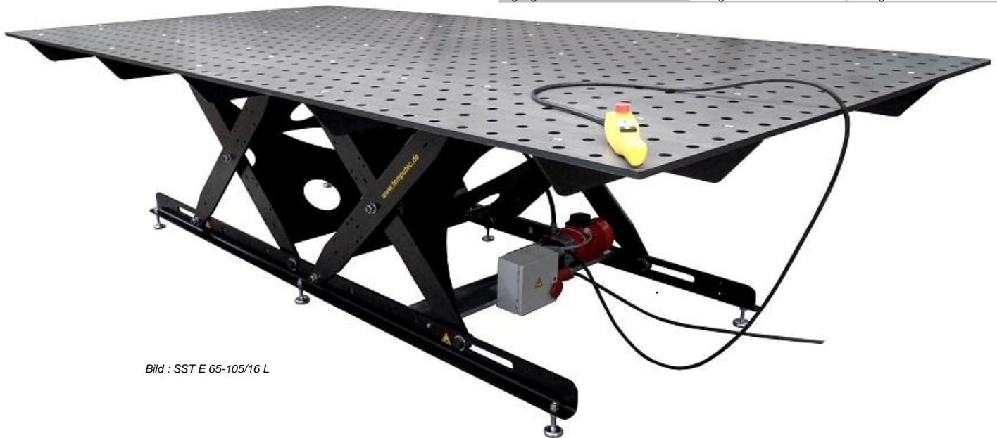
Bild : SST E 65-105/16 L