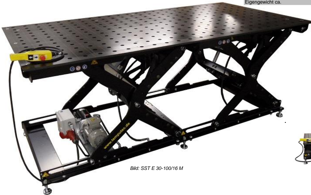
Bild: SST E 30-100/16 M