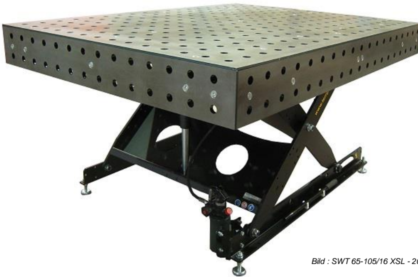
Bild : SWT 65-105/16 XSL - 200