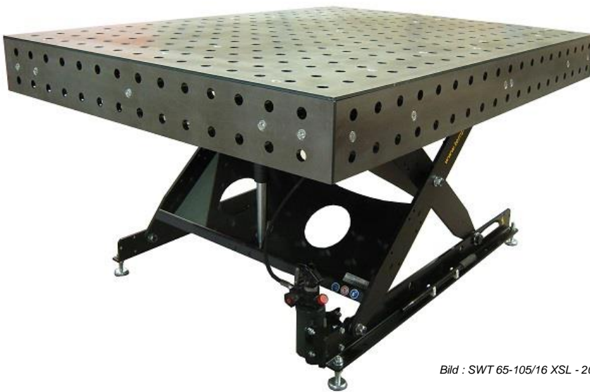
Bild : SWT 65-105/16 XSL - 200