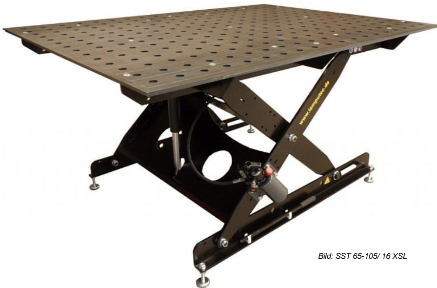
Bild: SST 65-105/ 16 XSL