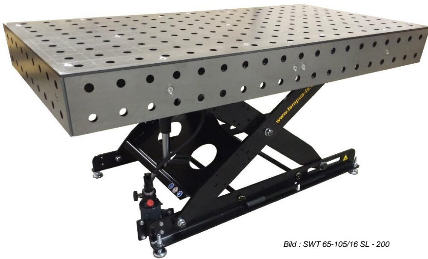
Bild : SWT 65-105/16 SL - 200