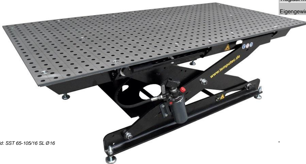
Bild: SST 65-105/16 SL Ø16