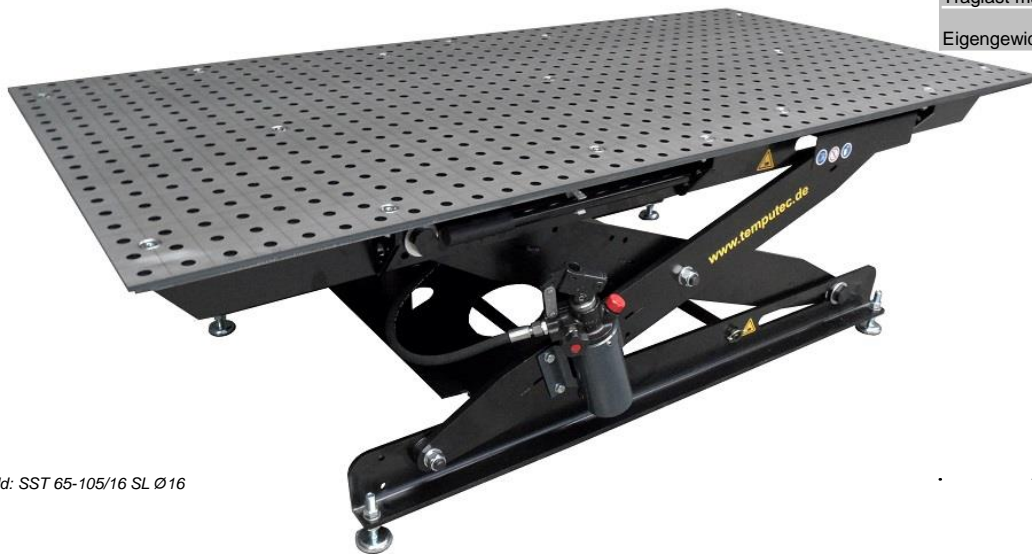
Bild: SST 65-105/16 SL Ø16