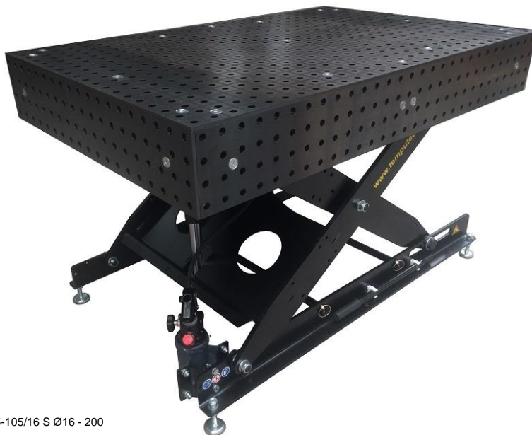
Bild: SWT 65-105/16 S Ø16 - 200