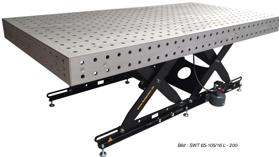
Bild : SWT 65-105/16 L - 200