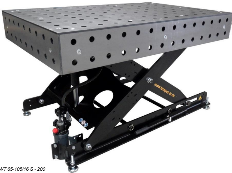
Bild : SWT 65-105/16 S - 200