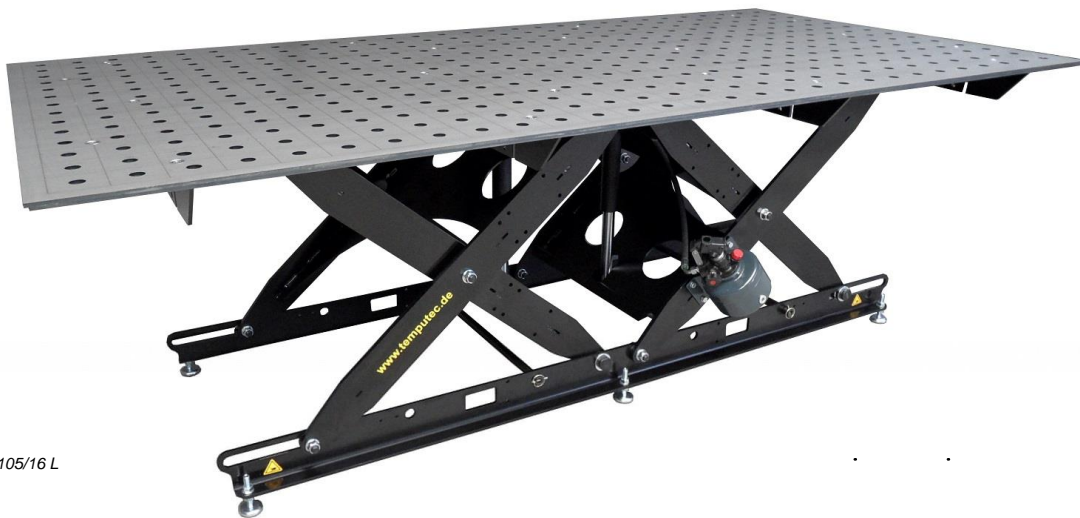
Bild : SST 65-105/16 L