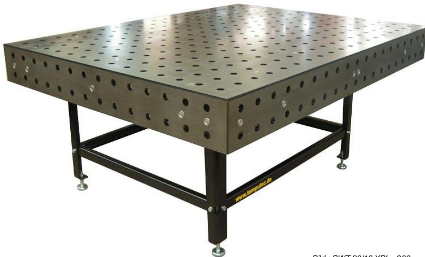
Bild : SWT 80/16 XSL - 200