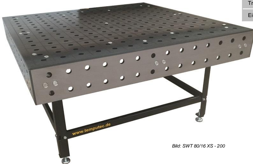
Bild: SWT 80/16 XS - 200