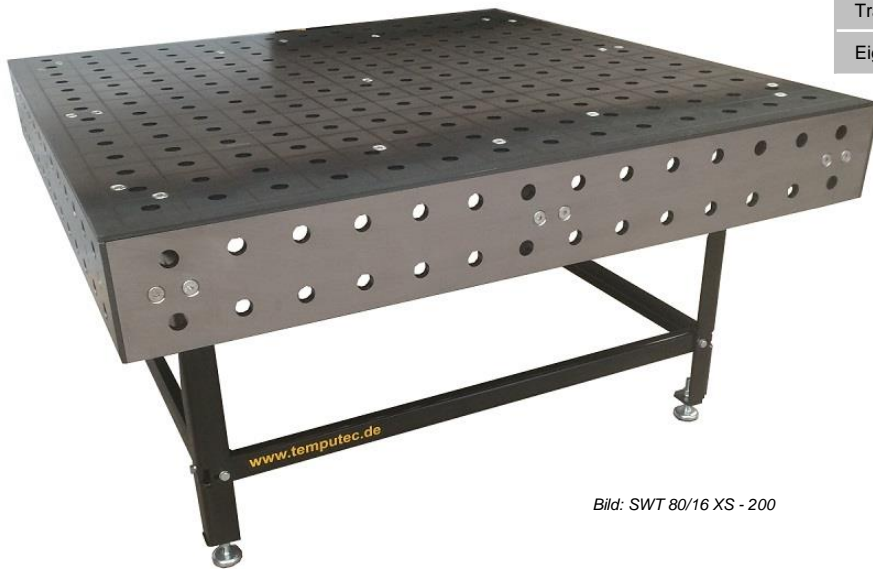
Bild: SWT 80/16 XS - 200