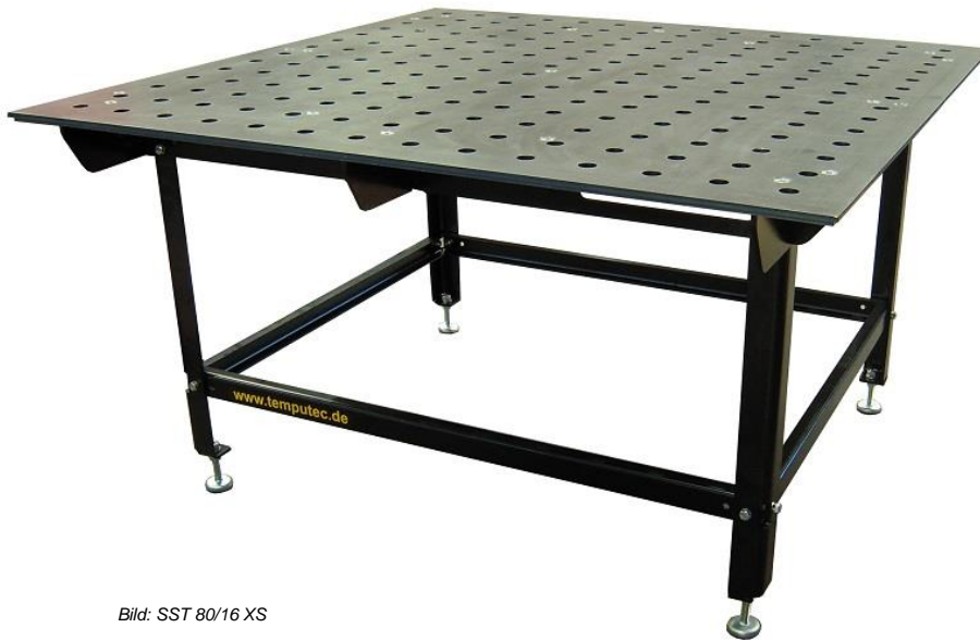
Bild: SST 80/16 XS