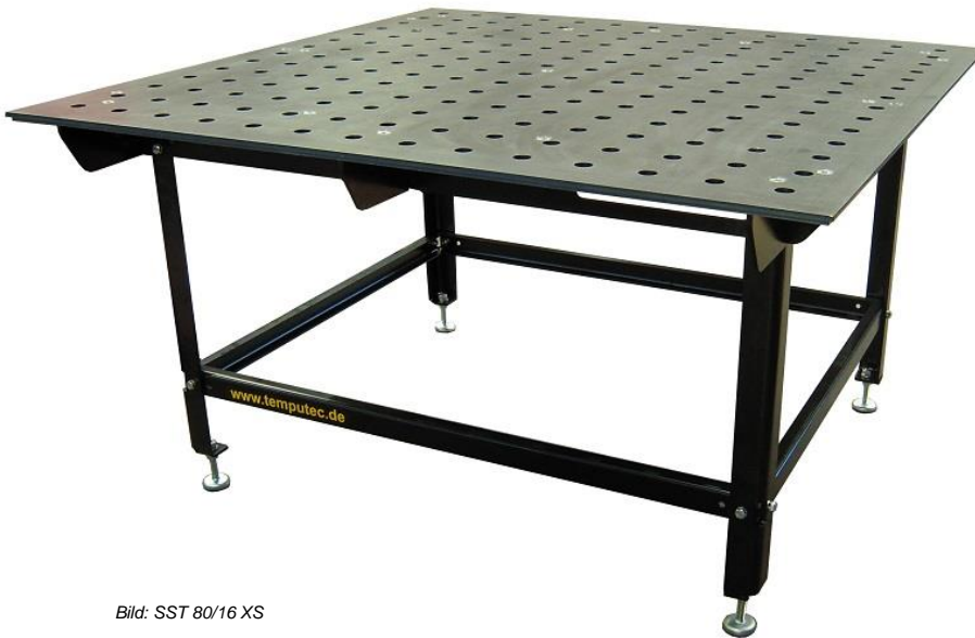
Bild: SST 80/16 XS