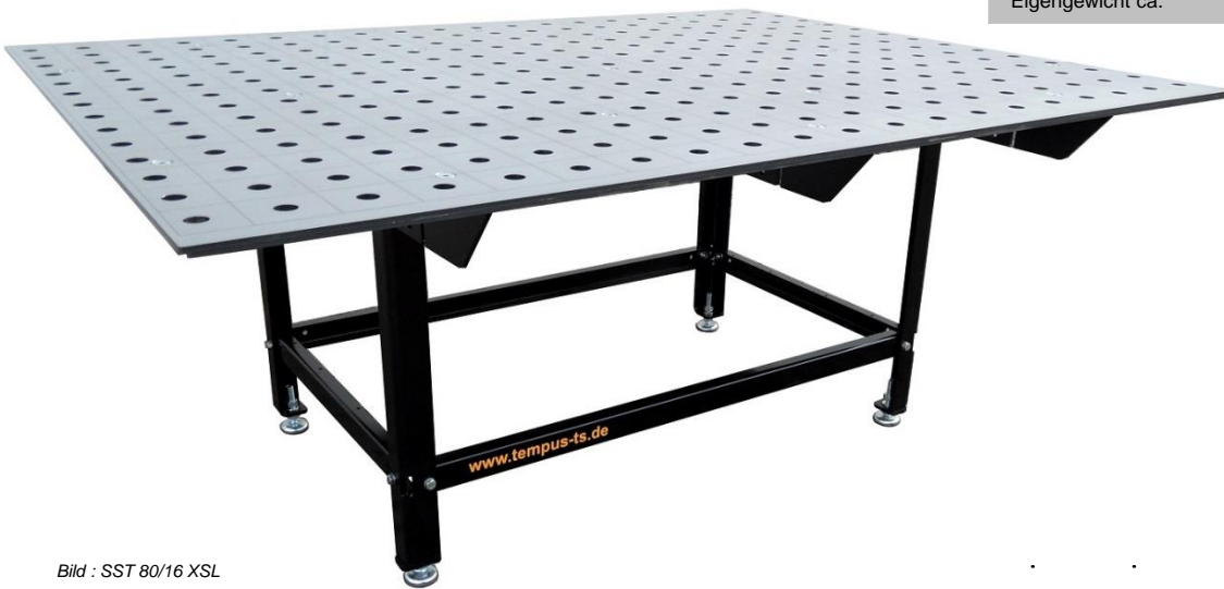
Bild : SST 80/16 XSL