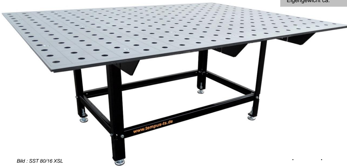
Bild : SST 80/16 XSL