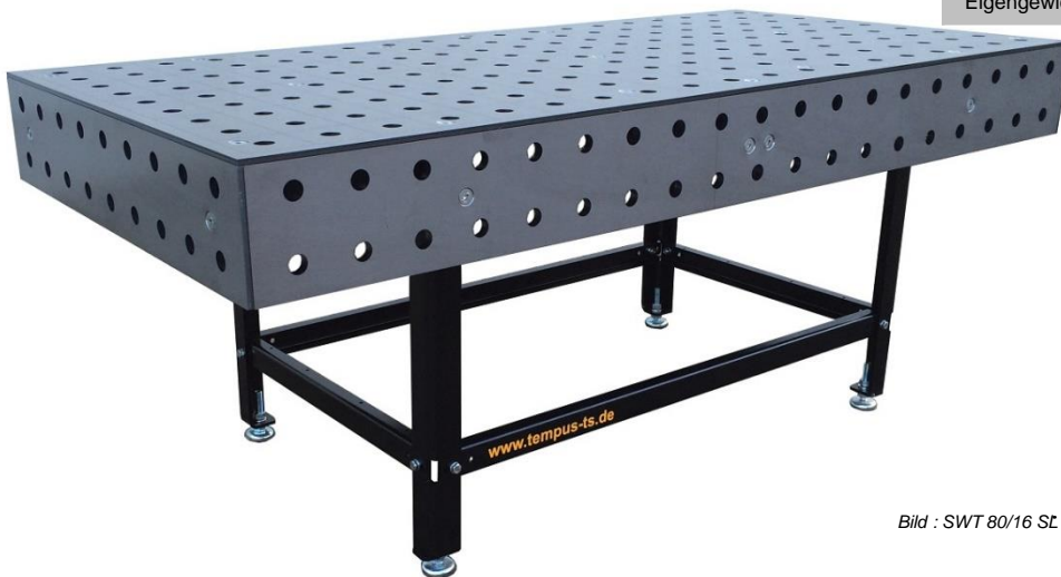
Bild : SWT 80/16 SL - 200