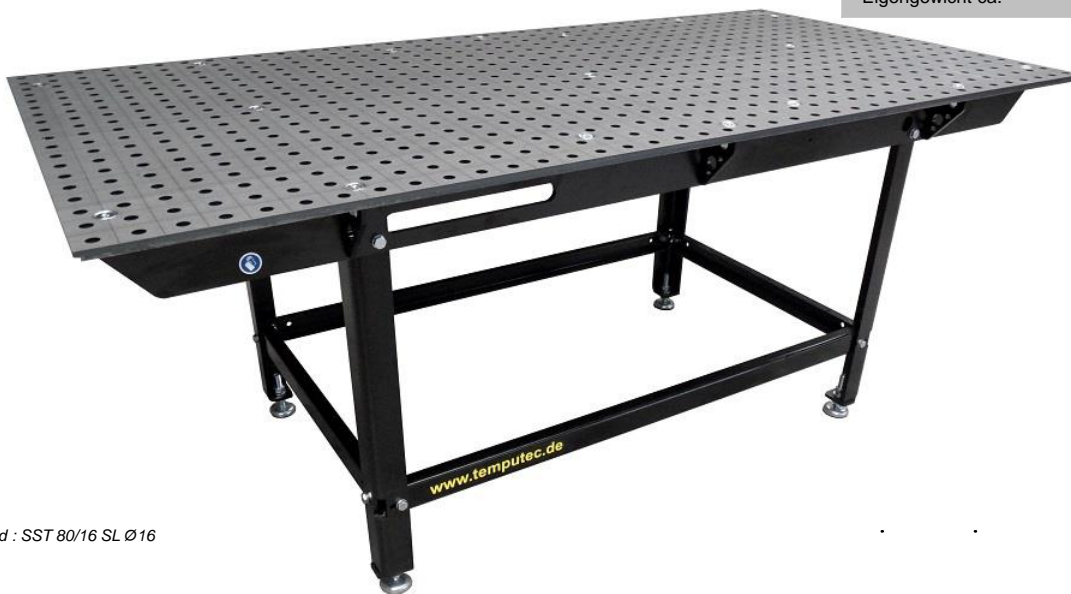
Bild : SST 80/16 SL Ø16