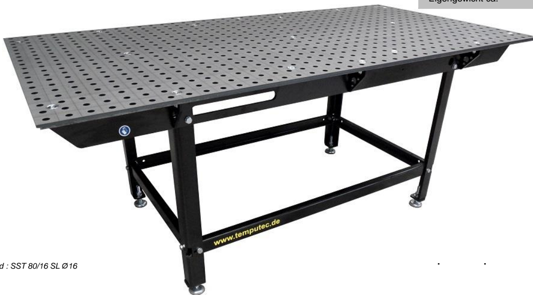
Bild : SST 80/16 SL Ø16