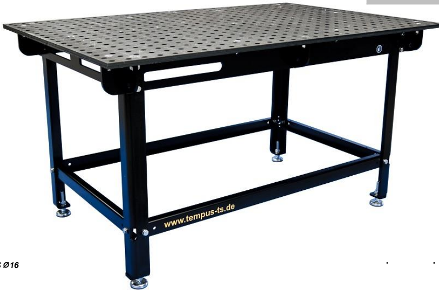
Bild : SST 80/16 S Ø16