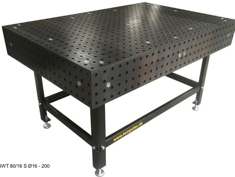
Bild: SWT 80/16 S Ø16 - 200