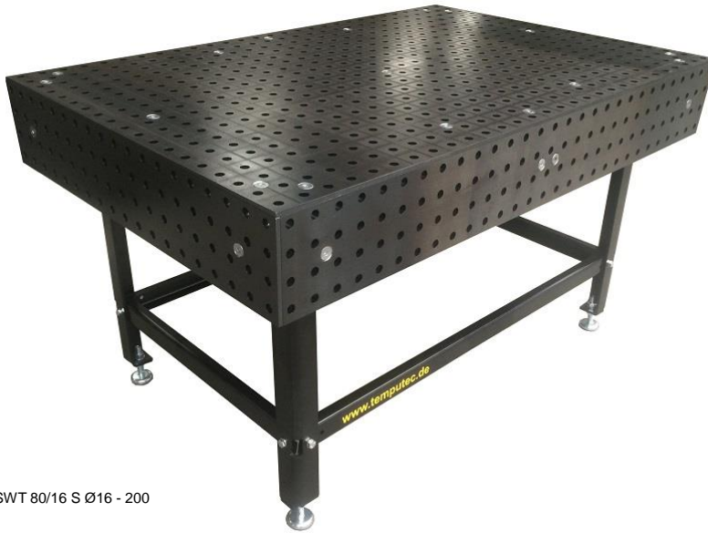
Bild: SWT 80/16 S Ø16 - 200