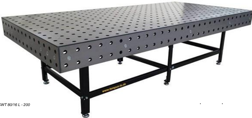
Bild : SWT 80/16 L - 200