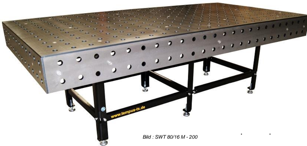
Bild : SWT 80/16 M - 200