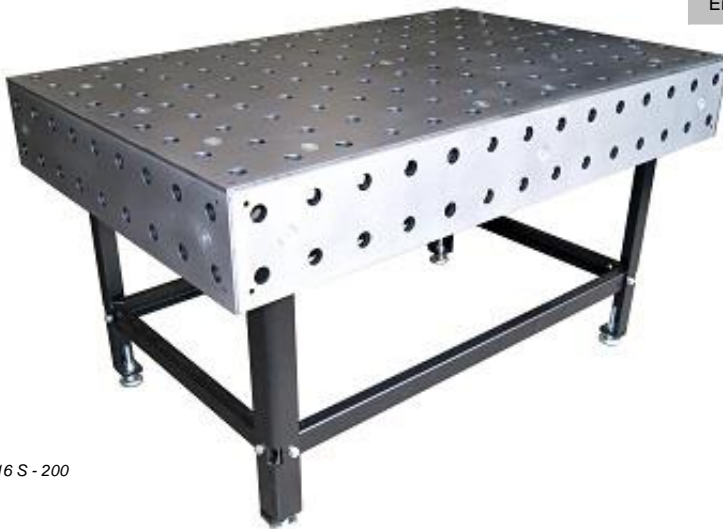
Bild : SWT 80/16 S - 200