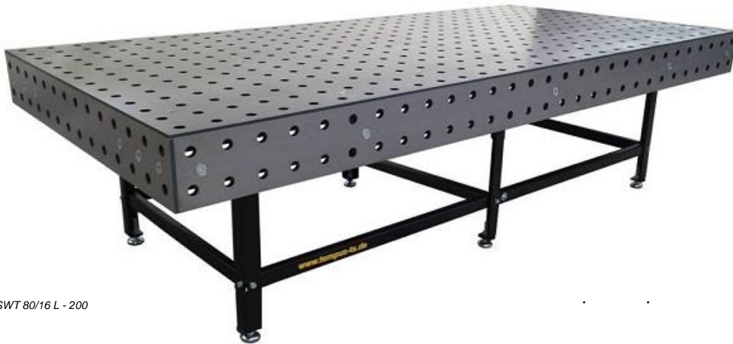
Bild : SWT 80/16 L - 200