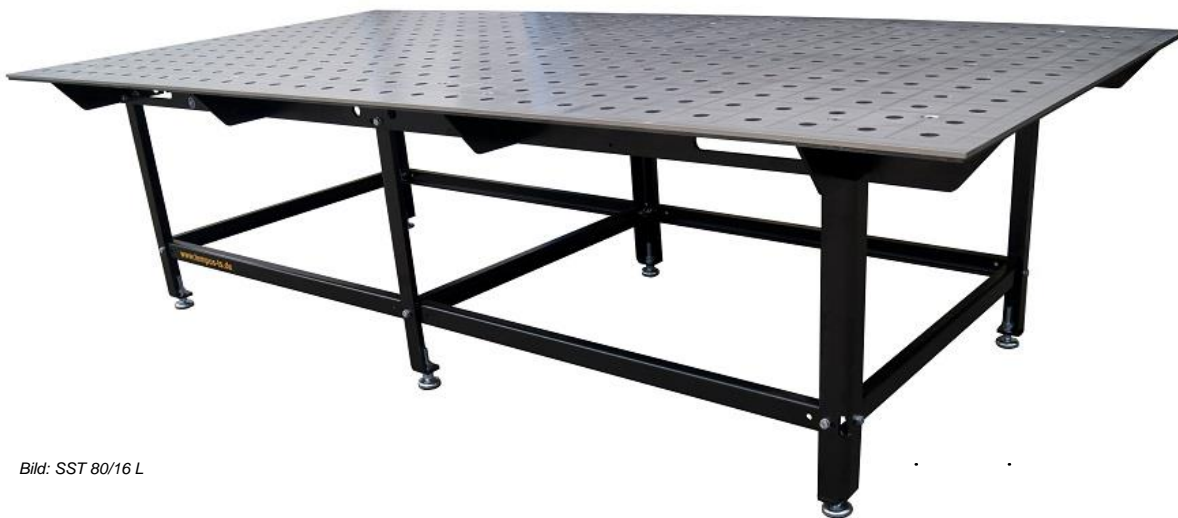
Bild: SST 80/16 L