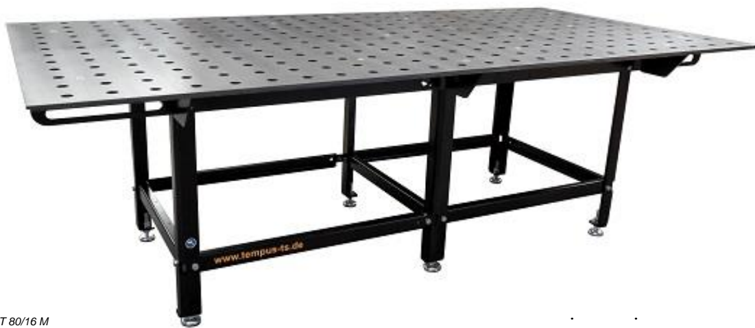
Bild.: SST 80/16 M