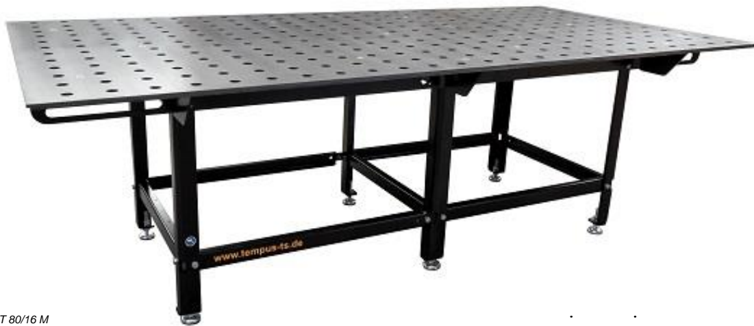
Bild.: SST 80/16 M