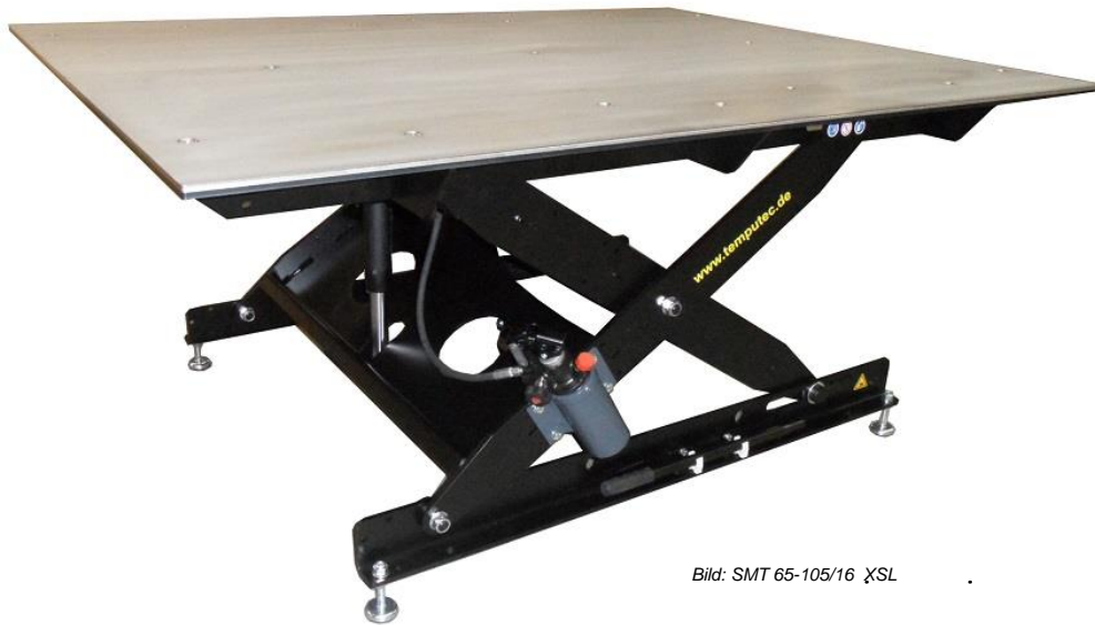
Bild: SMT 65-105/16 XSL