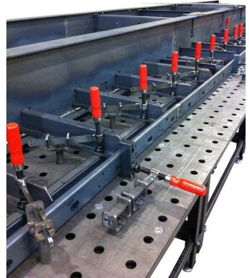
Bilder: Anwendungsbeispiel Spanner