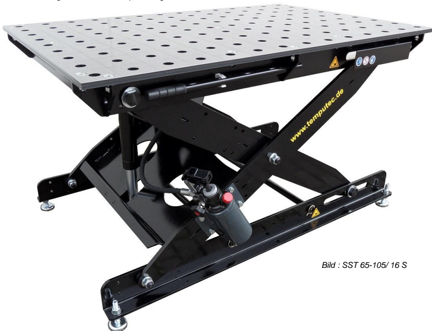
Bild : SST 65-105/ 16 S