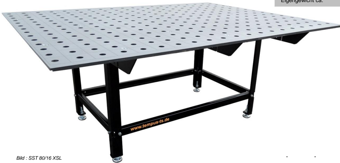
Bild : SST 80/16 XSL