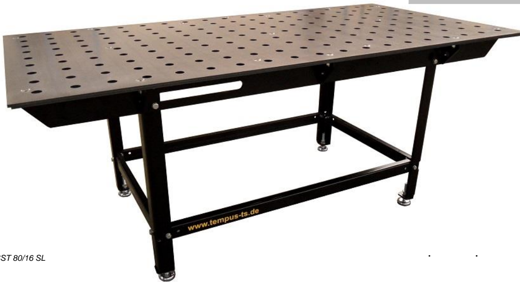
Bild : SST 80/16 SL