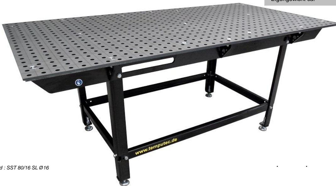
Bild : SST 80/16 SL Ø16