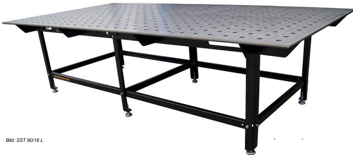
Bild: SST 80/16 L