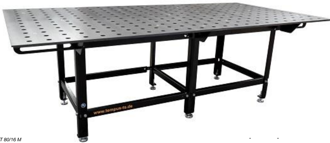
Bild.: SST 80/16 M