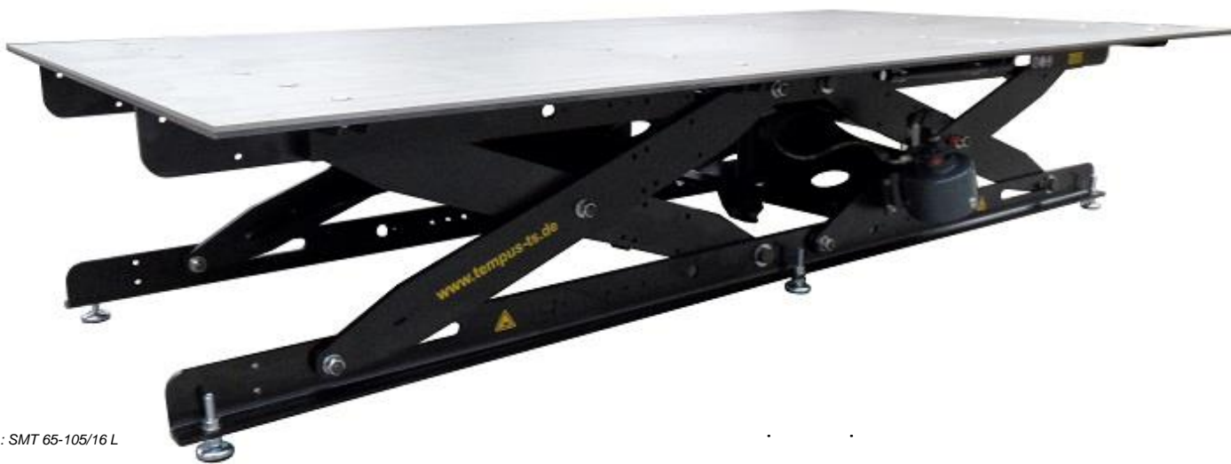
Bild : SMT 65-105/16 L